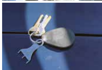
Janne Jonssons fina Ford Fairlane -54 med en massa options. Nyckeln med tre piggar hör till rattväxellåset.