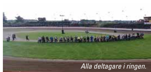
Alla deltagare i ringen.