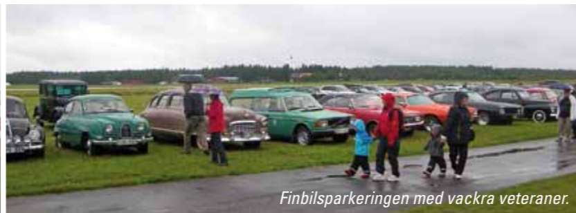
Finbilsparkeringen med vackra veteraner.

På Tekniklandssäsongsens sista dag så kom Motorbranschens Riksförbund och hade sitt 50-årsfirande på Teknikland. En mycket trevlig dag som innehöll både nya bilar som bilhandlarna visade upp och veteranbilsparering som kontrast. Det var godisregn för barnen och helikopteruppstigningar. Även underhållning fanns i form av Philips Combo som underhöll hela dagen! Det fanns alltså något för alla och dagen till ära var det gratis inträde på museet.