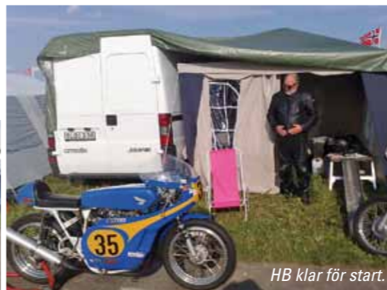
HB klar för start.