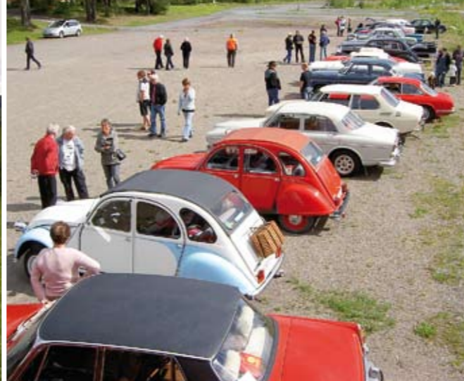
Veteranbilar i väntan på start från Nyhedens skola: Närmast taket på en Rover, två st Citroën 2 CV, Volvo Amazon, Saab 99, Alfa Romeo GT3, Ford Zephyr med flera.