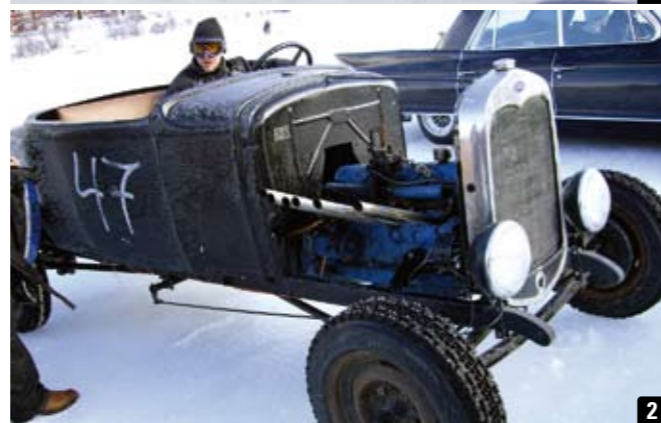
1. En -35 Ford som närmast för tankarna till Svensk "Stock-Car Racing" från det tidiga 60-talet, eller kanske valfri gangsterfilm... :-).