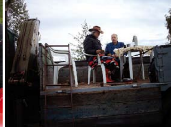
En bit på väg mot sjunde himlen.