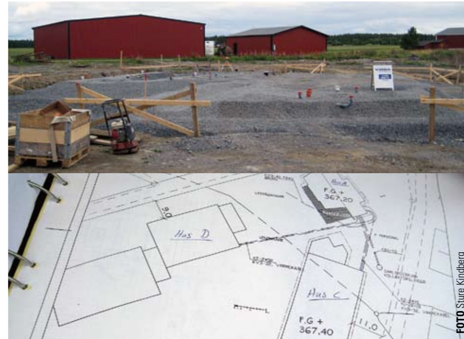
Grundläggningsarbetena av gemensamhetsbyggnaden har nu startat. Hus A Gemensamhetsbyggnaden, hus C Veteranfordonsmuséet och hus D Militärmuséet.