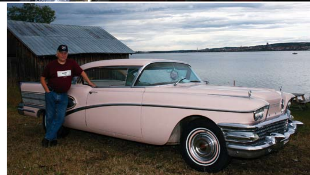
Formidabel Buick med skön stad som bakgrund.