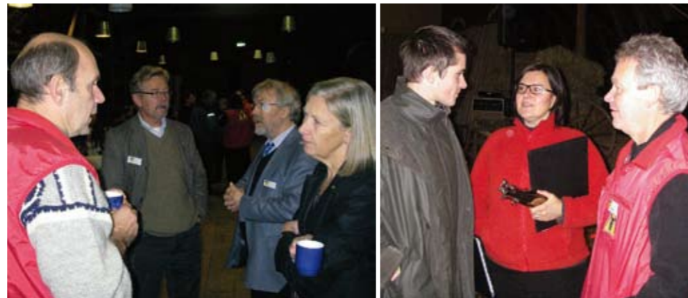
TEXT & FOTO Ingrid Rosell