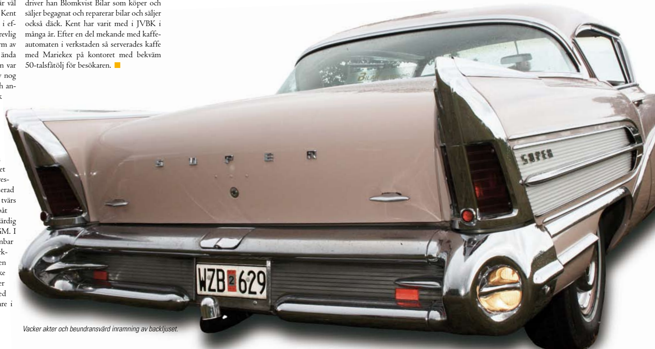
Vacker akter och beundransvärd inramning av backljuset.