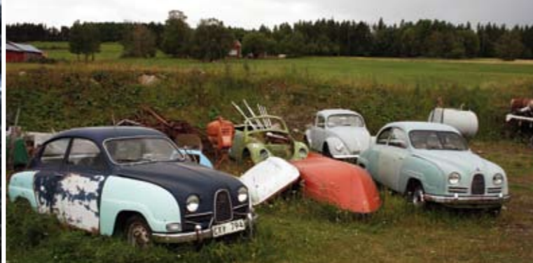
En del av den Blomkvistska samlingen av fordon.