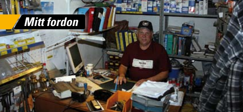
Det effektiva kontoret samsas med firmans lager.