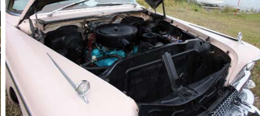
Välstädat och snyggt i det rymliga motorutrymmet.